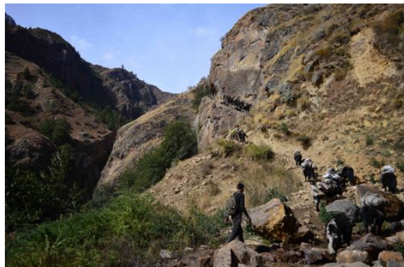
Sentier de randonnée près de Simikot avec les mules qui portent les bagages