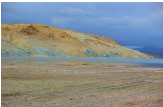
La « plage de la vérité », au-dessous de Chiu gompa, lac Manasarovar