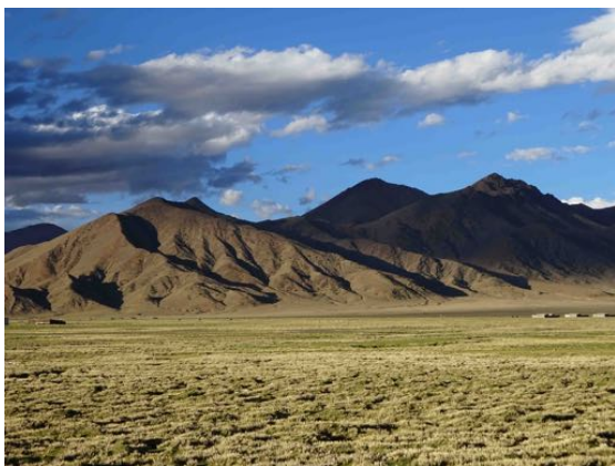
Haut plateau tibétain sur la route vers le Kailash